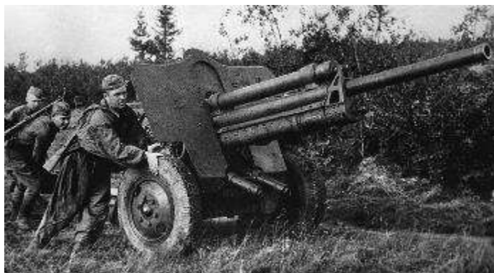
Исты – исты – исты – отважные ... (артиллеристы).