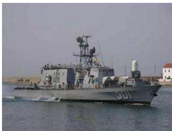
Ли – ли – ли – а это военные ... (корабли).