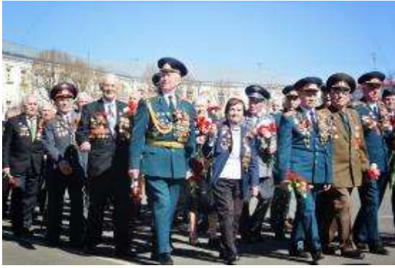
Аны – аны – аны – шагают ... (ветераны).