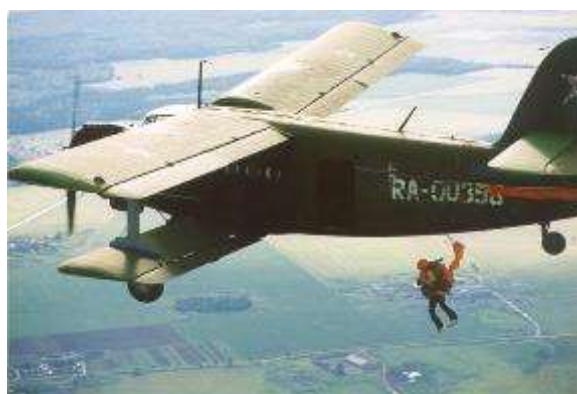
Исты – исты – исты – спускаются ... (парашютисты).