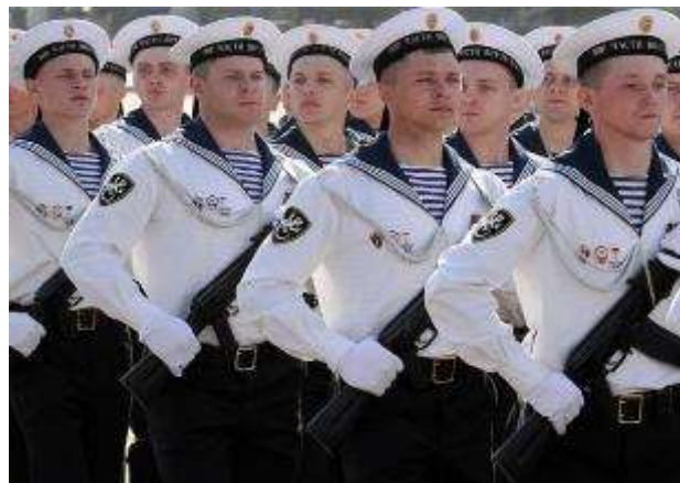
Ки – ки – ки – воюют наши ... (моряки).