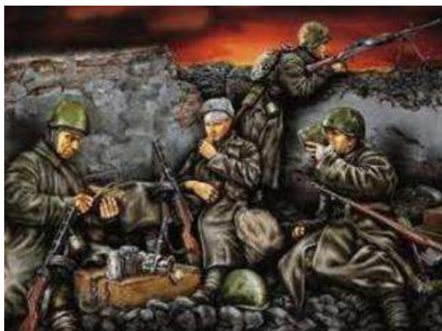
Цы – цы – цы – смелые ... (бойцы).