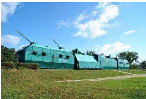
Зда – зда – зда – по рельсам едут ... (бронепоезда).