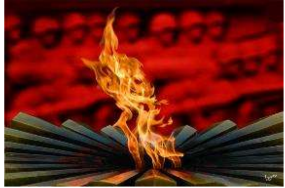
Онъ – онъ – онъ – горит вечный ... (огонь).