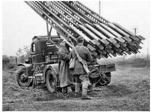
Ши – ши – ши – громко бьют ... (Катюши).