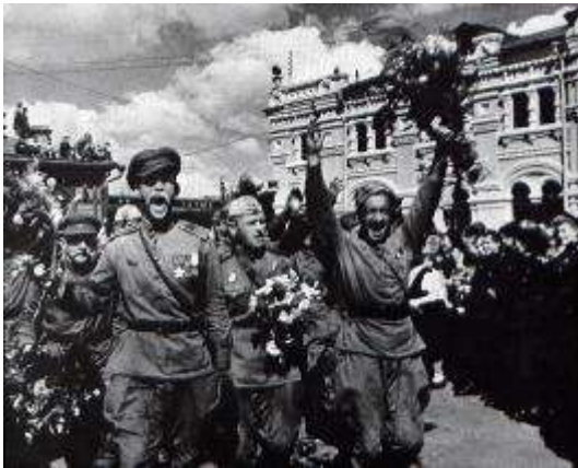
Ра – ра – ра – народ кричит ... (Ура!)