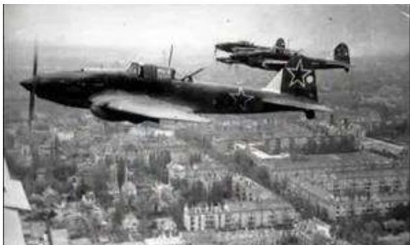
Ёты – ёты – ёты – в небе ... (самолёты).