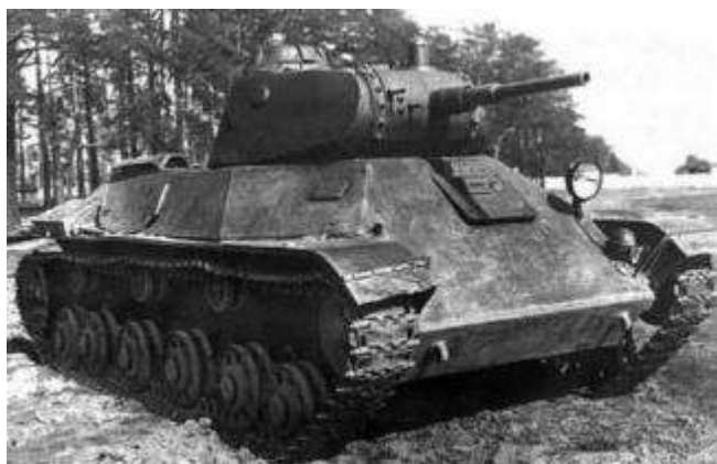
Ки – ки – ки – в бой идут ... (танки).