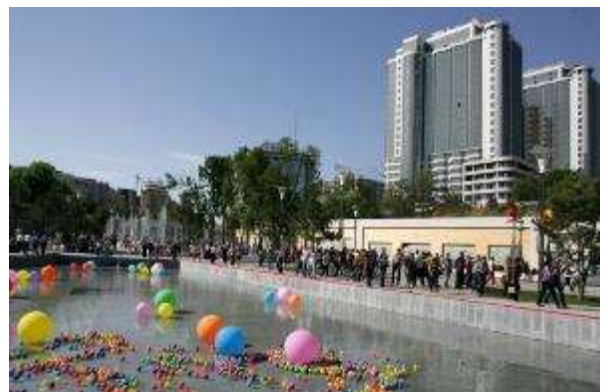
Ир – ир – ир – нет войне, нам нужен ... (мир).