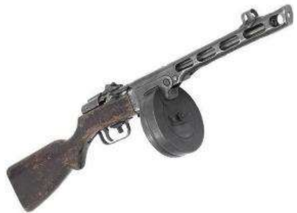
Ат – ат – ат – стреляет ... (автомат).