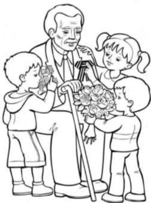
9 мая - День Победы

Один из таких памятников находится у Кремлевской стены. Это Вечный огонь - памятник неизвестному солдату, который сражался с фашистами.